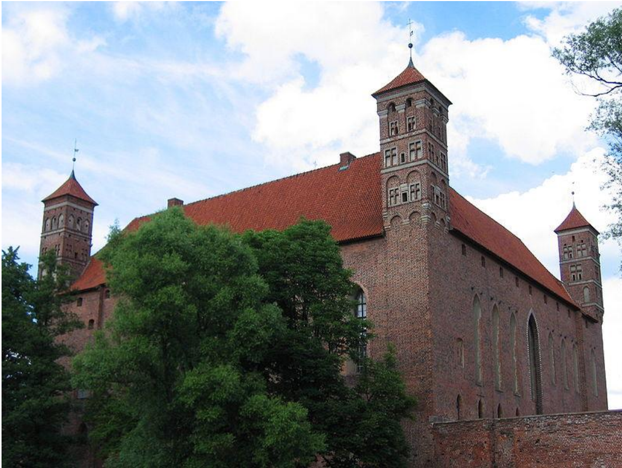
Zamek w Lidzbarku