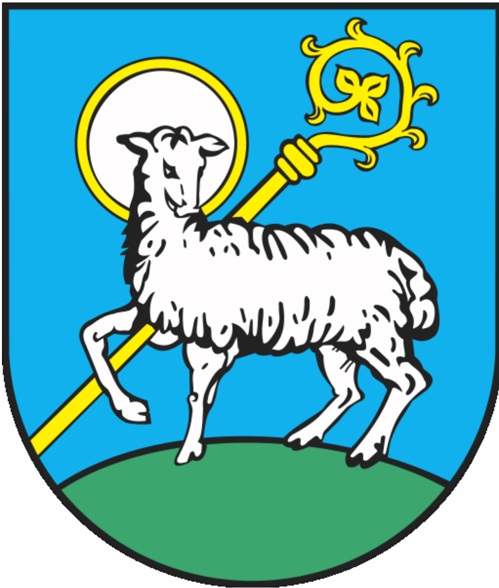
Herb Lidzbarka Warmińskiego

http://pl.wikipedia.org/wiki/Herb_Lidzbarka_Warmińskiego