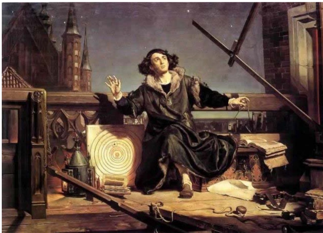
Astronom Kopernik, czyli rozmowa z Bogiem, obraz Jana Matejki